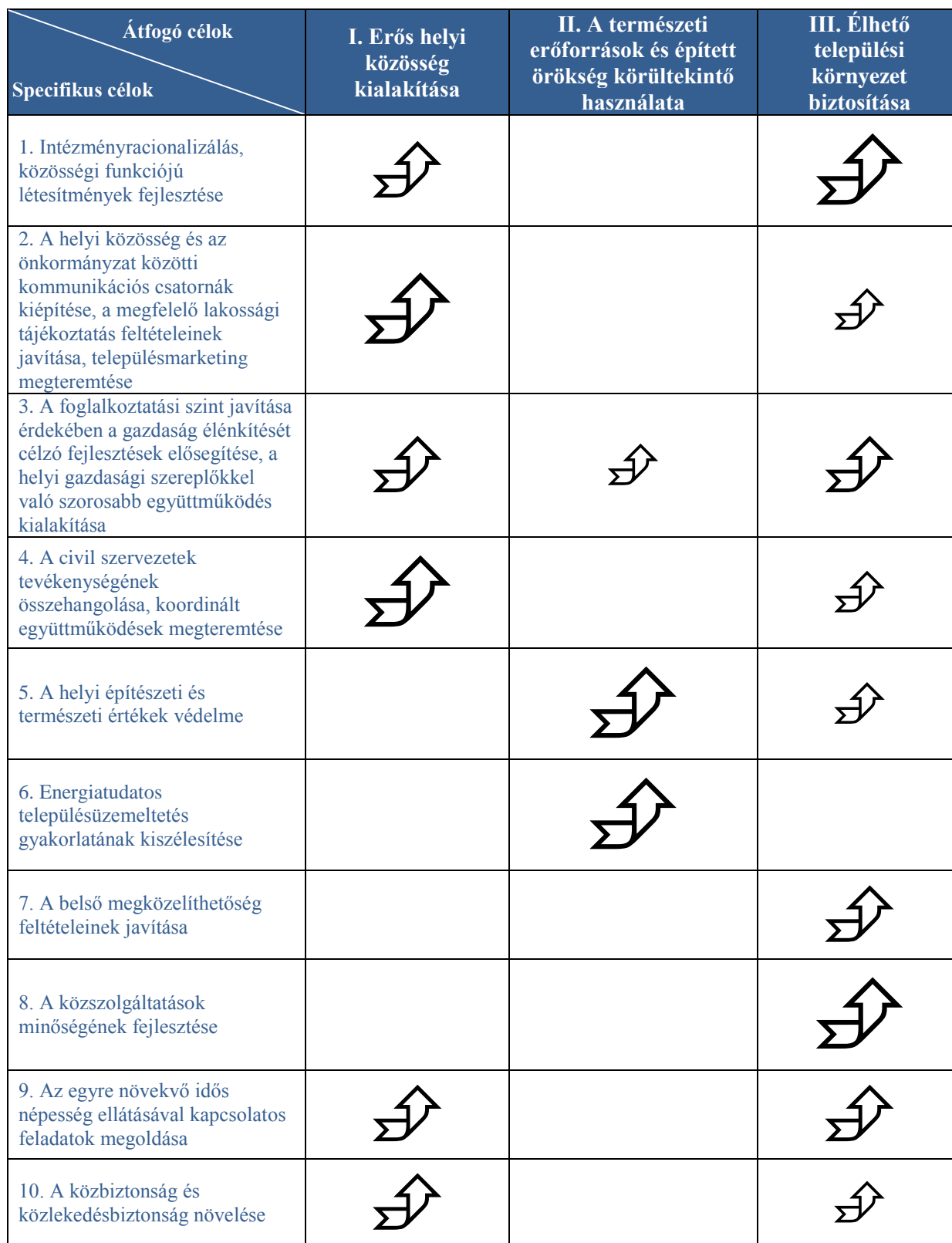
2. ábra: Az átfogó és a specifikus célok kapcsolatrendszere